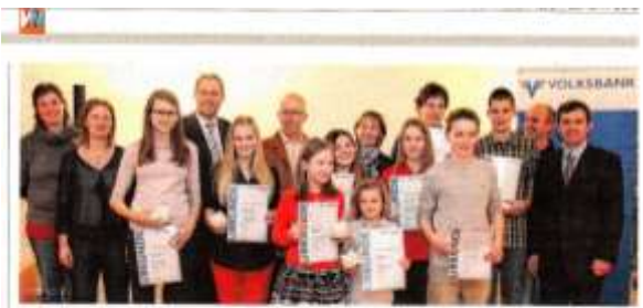
Die glücklichen Preisträger der VVB-Förderpreise 2015.