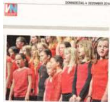
Die Musikschule Rankweil-Vorderland lädt am 8. Dezember zum Adventkonzert in die Pfarrkirche St. Josef...

Mit einem Teil der Spenden wollen wir die Renovierung der St. Peter-Kirche unterstützen.