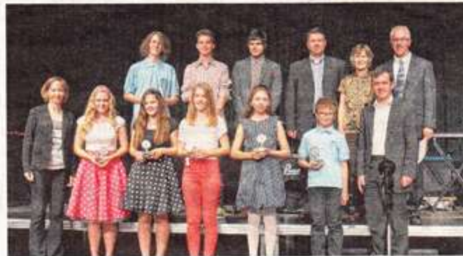
Die Preisträger der Musikschule Rankweil-Vorderland beim Bundeswettbewerb „Prima la Musica“ in Eisenstadt.