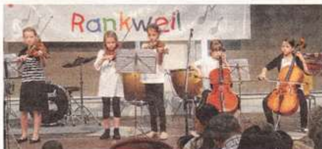
Tag der offenen Tür an der Musikschule Rankweil-Vorderland.

musikschule@rankweil.at www.rankweil.at/musikschule