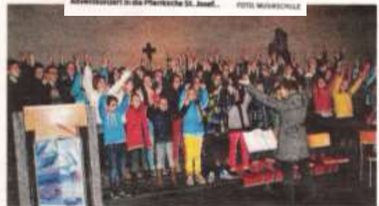
Zarte Klänge bescherten den Zuhörern einen Vorgeschmack auf die nahehe Weihnachtszeit.