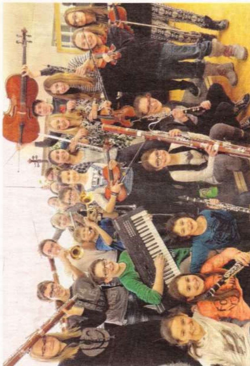
Die Mitglieder des noch sehr jungen Jugendorchesters Vorderland zeigen auf alle Fälle Freude am Musizieren.

24. Jänner, 19.30 Uhr, Vereinshaus Rankweil, Orchester der Musikschule Bregenzerswald, Jugendorchester Vorderland, Musikschulchöre Rankweil