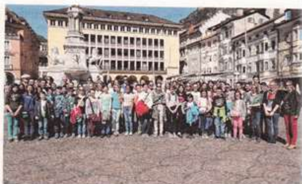
Bei der Konzertreise nach Bozen wurden die bestehenden Kontakte mit dem Südtiroler Chor vertieft.